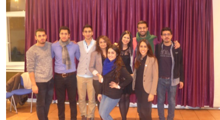
Neuer Regionalvorstand & Wahlleitung